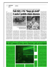
Superficie 32 %

ARTICOLO NON CEDIBILE AD ALTRI AD USO ESCLUSIVO DEL CLIENTE CHE LO RICEVE - 9193